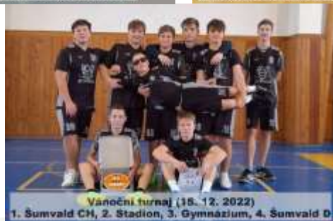
Vánoční turnaj (18. 12. 2022) 1. Šumvald CH, 2. Stadion, 3. Gymnázium, 4. Šumvald D