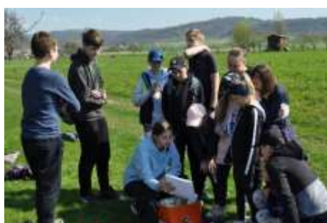
Soutěž mladých včelařů: Zlatá včela: 22.04.2023