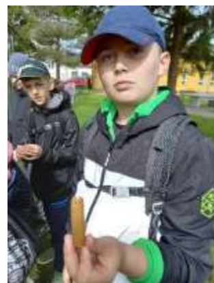
Exkurze do elektrárny Dlouhé stráně: 8., 9. třída: 23.05.2023