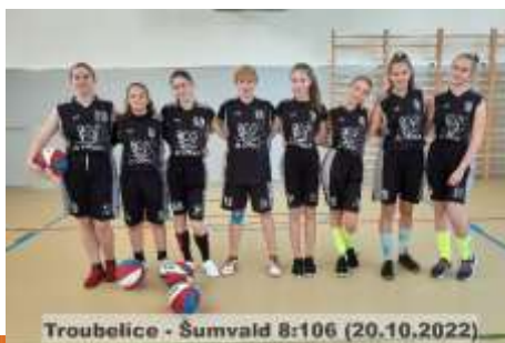
Troubelice - Šumvald 8:106 (20.10.2022)