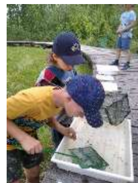
Ze života včel – ekologický program DDM Uničov: 4., 5. třída: 18.05.2023