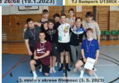
3. místo v okrese Olomouc (3. 5. 2023)