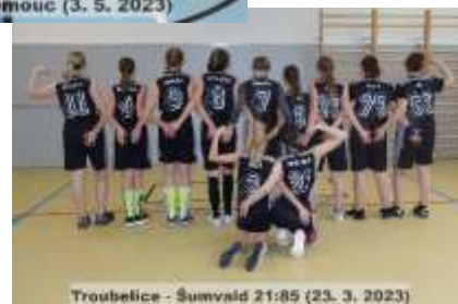
Troubelice - Šumvald 21:85 (23. 3. 2023)