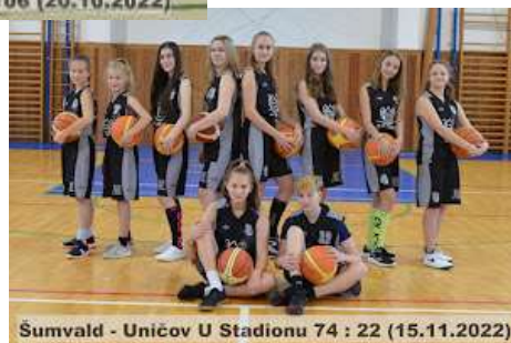
Šumvald - Uničov U Stadionu 74 : 22 (15.11.2022)