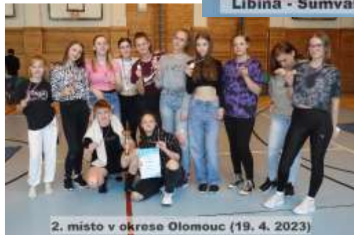
2. místo v okrese Olomouc (19. 4. 2023)