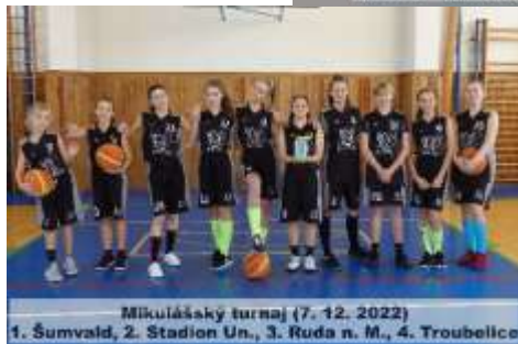
Mikulášský turnaj (7. 12. 2022) 1. Šumvald, 2. Stadion Un., 3. Ruda n. M., 4. Troubelice