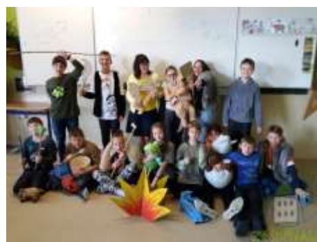
Zážitková hodina „Pravěk“: 6. třída: 11.10.2022