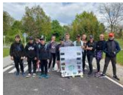
Zlatý list – soutěž, Uničov: 11.05.2023