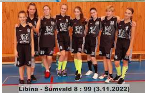
Libina - Šumvald 8 : 99 (3.11.2022)