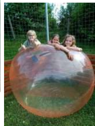
Třídní výlet 4. třída: Mladoňov