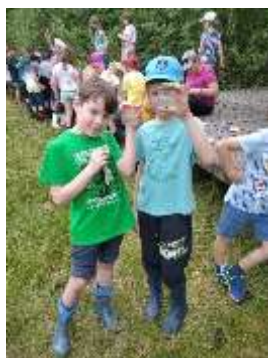
Kdo žije pod hladinou – ekologický program Sluňákov: 1.- 3. třída: 23.05.2023