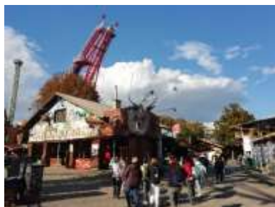
Zájezd do Vídně 7. – 9. třída: 22.09.2022