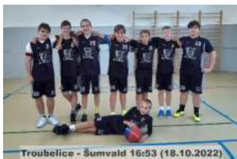
Troubelice - Šumvald 16:53 (18.10.2022)