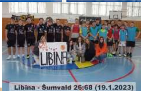
Libina - Šumvald 26:68 (19.1.2023)