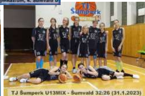
TJ Šumperk U13MIX - Šumvald 32:26 (31.1.2023)